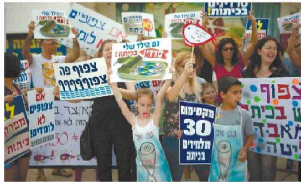
"מחאת הסרדינים" להקלת הצפיפות בבתי הספר, באוגוסט 2014.

משרד החינוך מתקצב את הגנים לפי תקן מיושן, שאינו מקובל בעולם המערבי. התקן היה קיים עוד לפני יישום התוכנית לחינוך חינם מגיל 3 ב-2012, כחלק מהמלצות ועדת טרכטנברג, שהגבירה את העומס על הסגל בגני הילדים