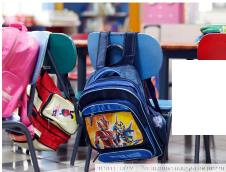
מי יממן את הקייטנות המסובסדות?

דפנה ליאל | חדשות 2 | פורסם 22:26 01/04/15